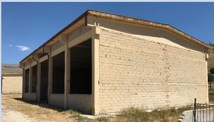
FABBRICATO I - FIENILE