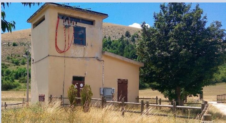
FABBRICATO M – CABINA ELETTRICA