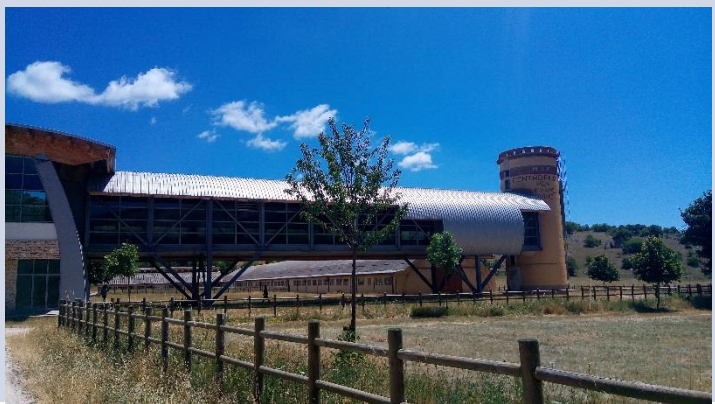
FABBRICATO G – SILOS + SPAZI ESPOSITIVI