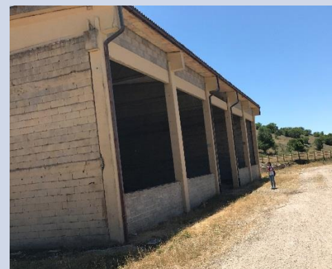
FABBRICATO L - FIENILE