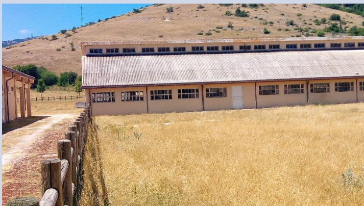
FABBRICATO C – UFFICI AMMINISTRATIVI