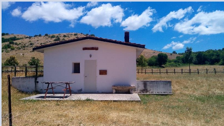
FABBRICATO G – SILOS + SPAZI ESPOSITIVI