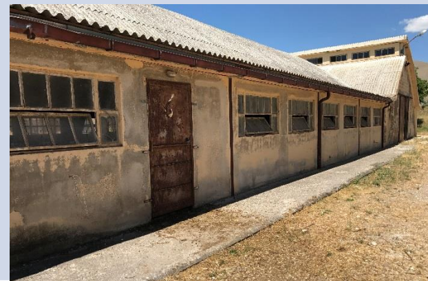
FABBRICATO D – ALLOGGIO CUSTODE