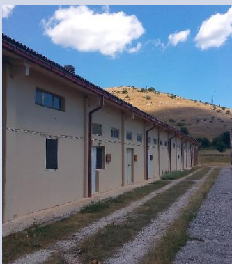
FABBRICATO C – UFFICI AMMINISTRATIVI