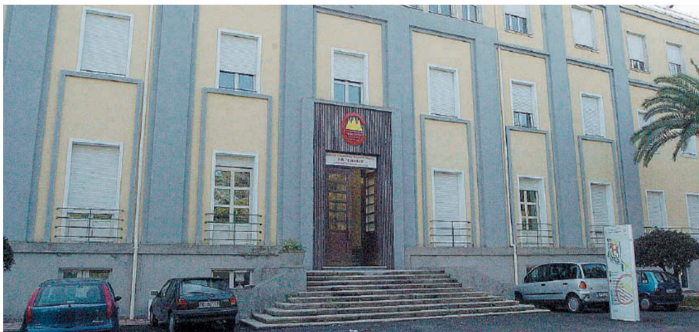
Ciacchio-De Lellis. Il plesso sarà oggetto di ampliamento e ospiterà l'Oncologia